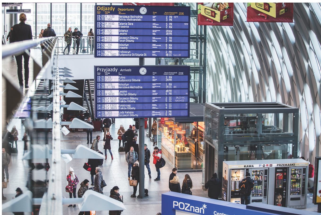
Nowa hala Dworca Głównego w Poznaniu

Wzrost liczby pasażerów obserwuje się zarówno u przewoźników dalekobieżnych, regionalnych, jak i aglomeracyjnych. W 2019 roku najwięcej pasażerów korzystało z usług Przewozów Regionalnych (marka POLREGIO), Kolei Mazowieckich, PKP Intercity i PKP SKM w Trójmieście (łącznie ponad 72%). Najwięcej osób, bo blisko 89 mln, skorzystało z usług spółki Przewozy Regionalne. To o 7,7 mln pasażerów więcej niż rok wcześniej. Przewoźnik ten odgrywa ważną rolę w ruchu regionalnym, obsługując mniejsze ośrodki. Jest także głównym operatorem kolejowym w województwach, w których nie powstały kolejowe spółki samorządowe.