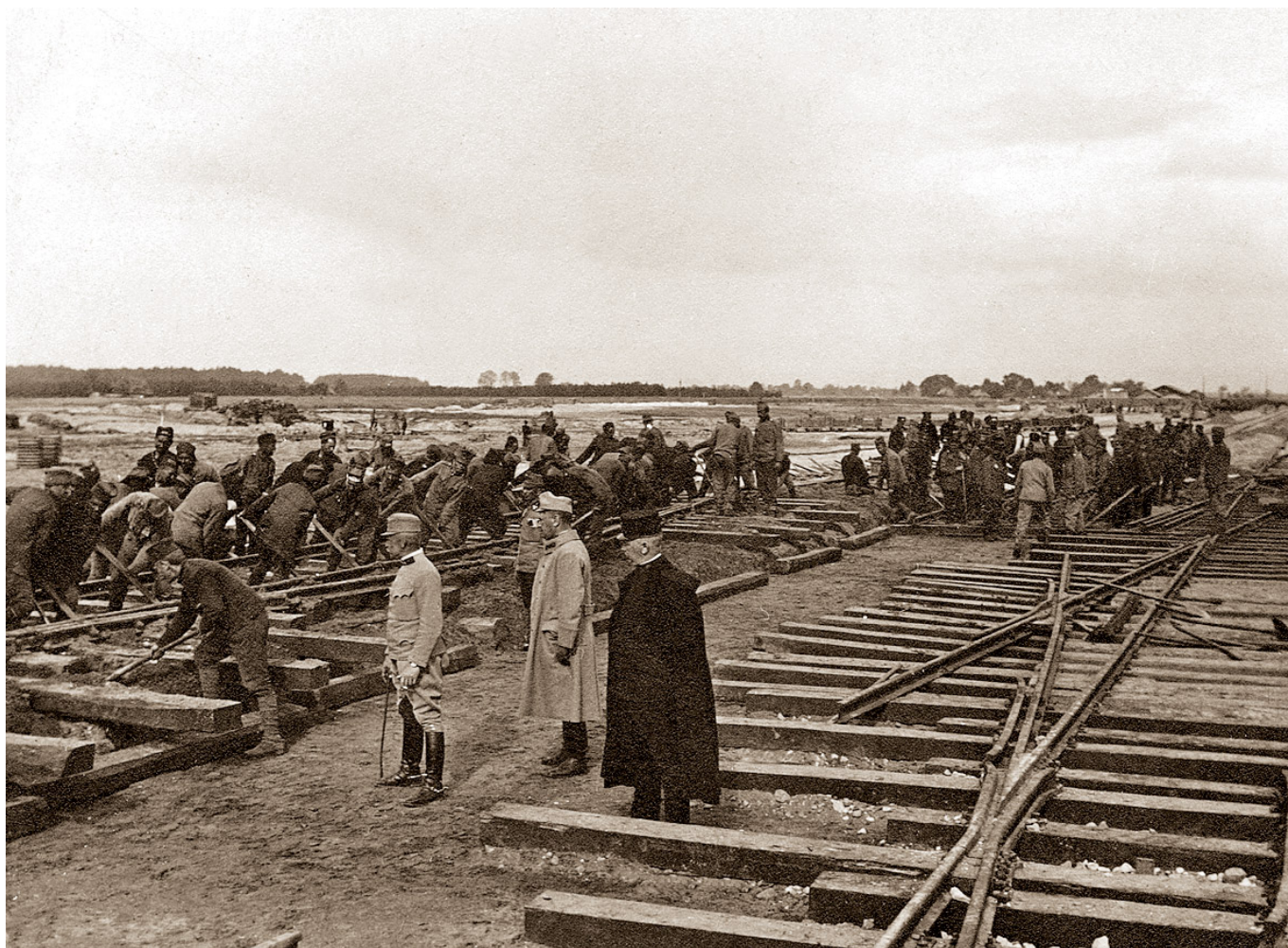
Kontrola postępu prac podczas budowy Galicyjskiej Kolei Żelaznej - koniec XIX w.

Rząd Austro-Węgier realizował plan upaństwowienia kolei, w ramach którego linie z Przemyśla do Łupkowa należące do Pierwszej Węgiersko-Galicyskiej Kolei Żelaznej i Kolej Lwowsko-Czerniowiecka przeszły w 1889 roku pod zarząd państwowy. Podlegały one utworzonym już w 1884 roku okręgom dyrekcyjnym w Krakowie i we Lwowie (oraz nadrzędnej Dyrekcji Kolei Państwowych w Wiedniu). Kolej Północną Cesarza Ferdynanda wykupiono z rąk prywatnych w 1906 roku i podporządkowano ją bezpośrednio dyrekcji w Wiedniu.