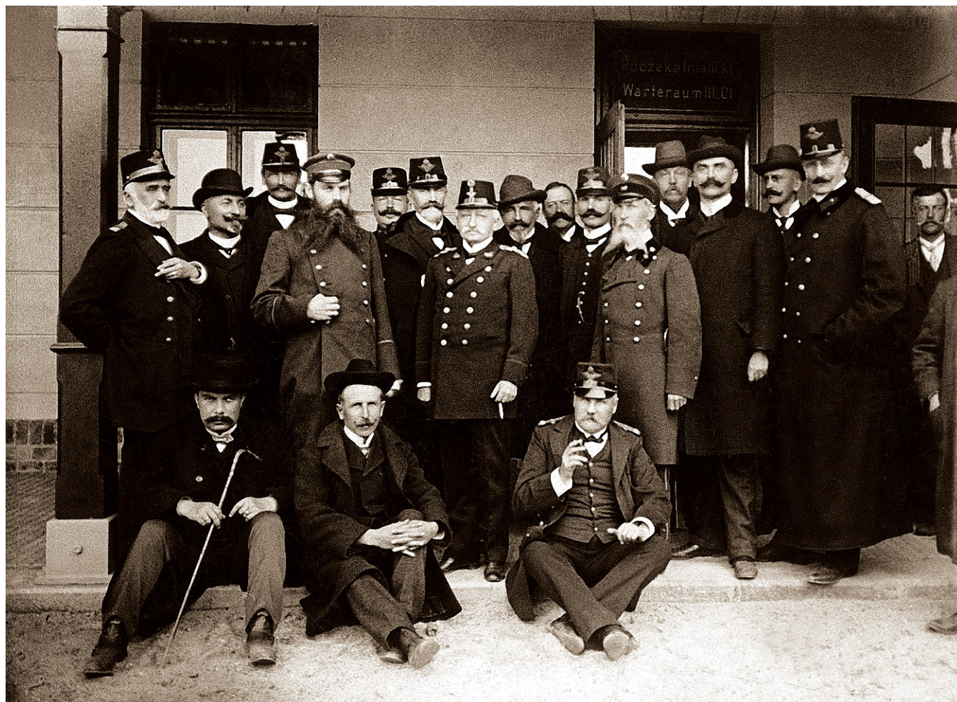
Otwarcie linii Kraków - Kocmyrzów - 1899 r.