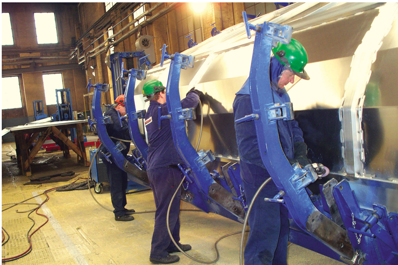
Zakłady Naprawcze Wagonów w Świdnicy (do 1951 r.), obecnie WAgony Świdnica S.A. - spawanie ścian wagonów

W 1992 roku nastąpiła prywatyzacja przedsiębiorstwa, które nosiło od tej pory nazwę Fabryka Wagonów „Świdnica” S.A. Sześć lat później posiadaczem większości akcji spółki została amerykańska firma The GreenbrierCompanies, zmieniając nazwę fabryki na WAgony Świdnica SA. W grudniu 2016 roku świdnicka firma uległa przekształceniu w spółkę z ograniczoną odpowiedzialnością, a jej jedynym udziałowcem został Greenbrier Europe B.V.