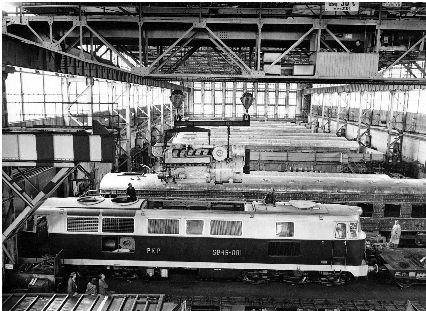
Wnętrze poznańskich zakładów H. Cegielskiego