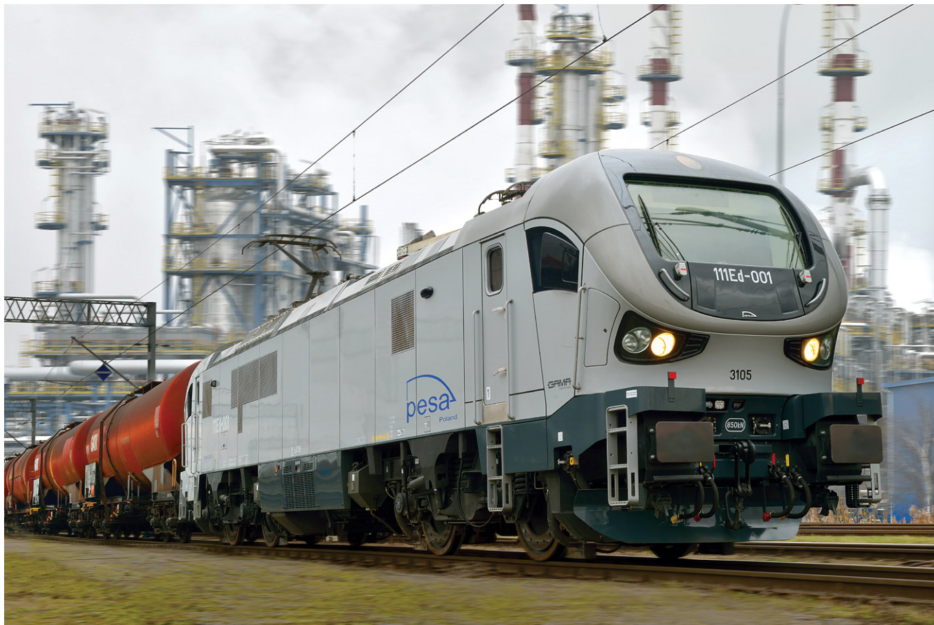
PESA Gama Marathon - lokomotywa elektryczna z dodatkowym agregatem spalinowym