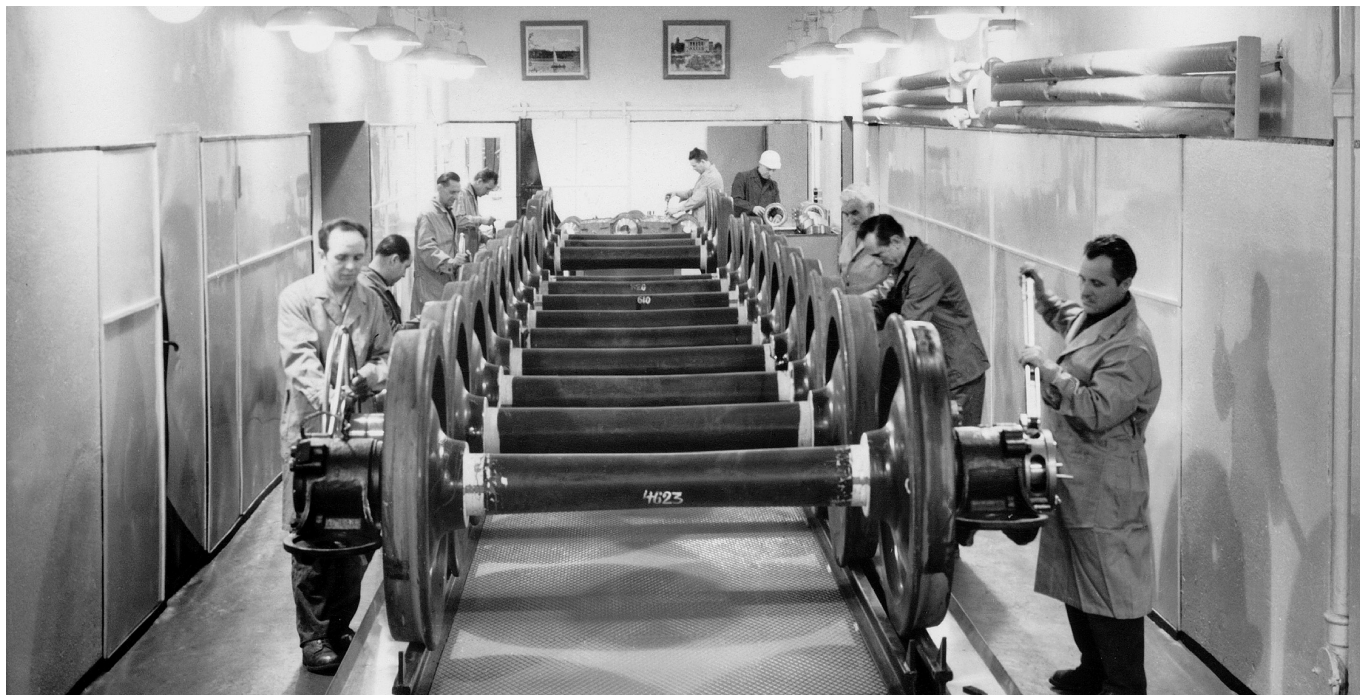
Montaż zestawów kołowych w fabryce H. Cegielskiego