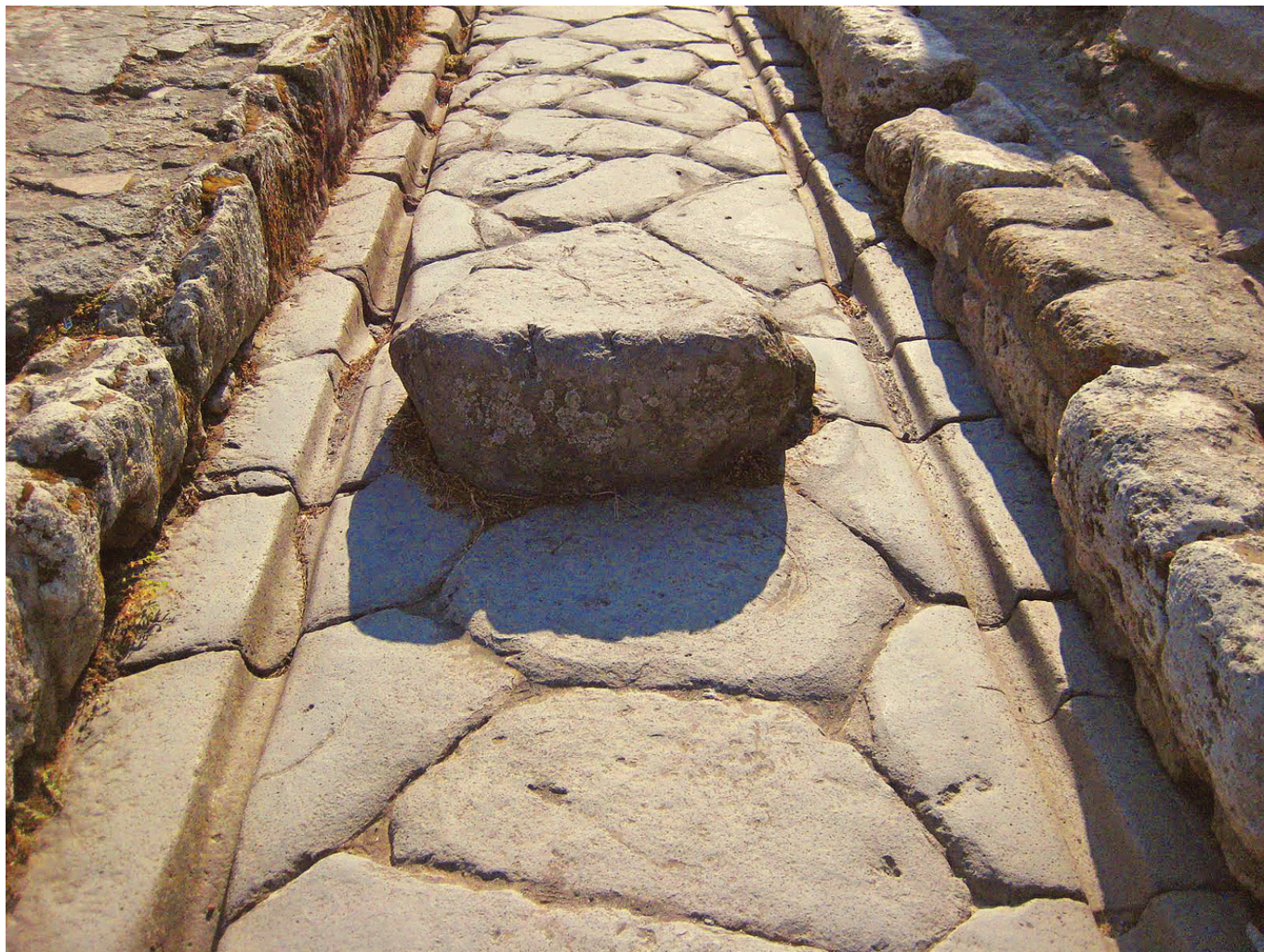
Kamienne koleiny w starożytnej drodze w Pompejach