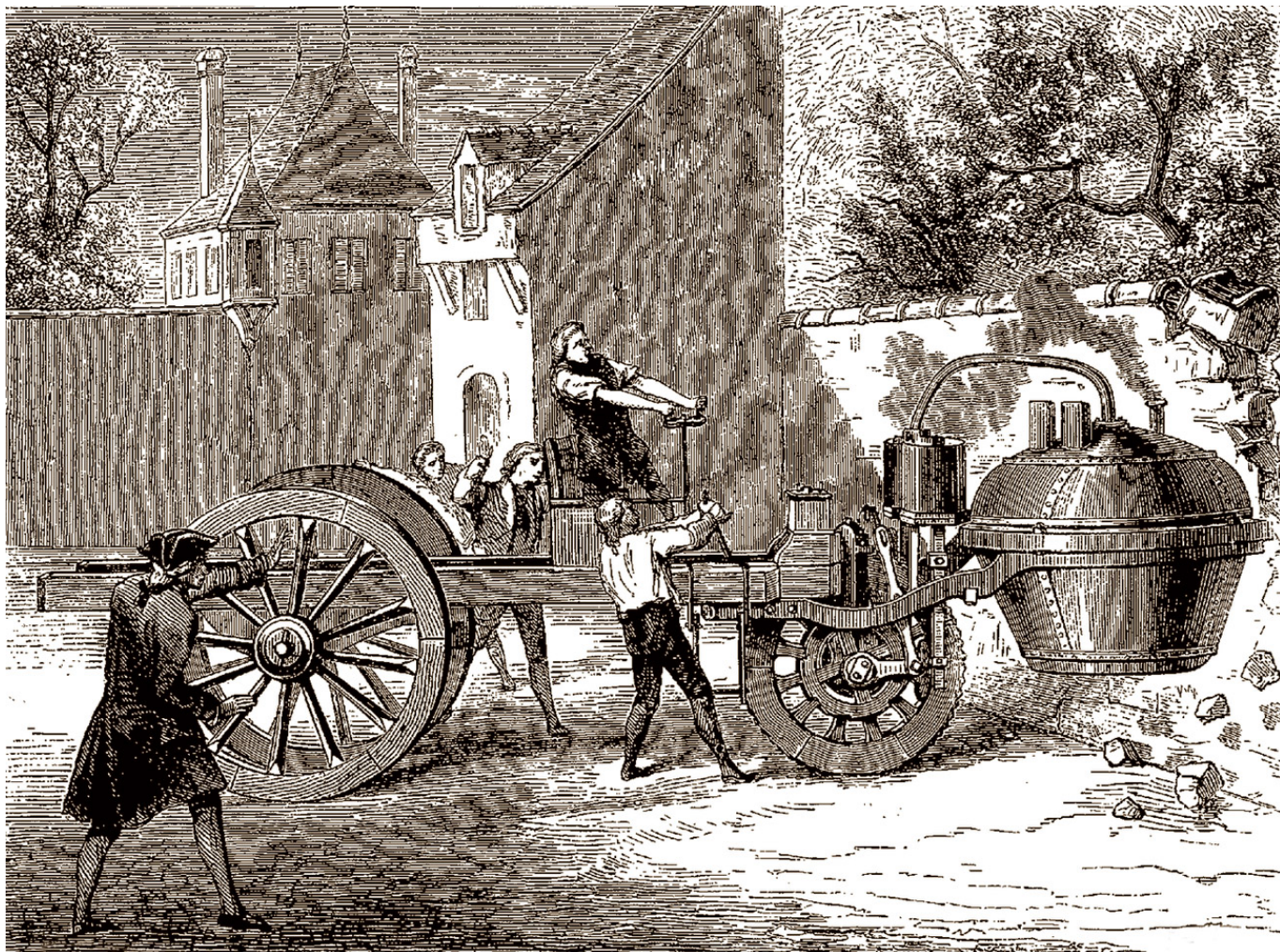
Nicolas Joseph Cugnot próbuje zatrzymać skonstruowany przez siebie pojazd napędzony maszyną parową podczas prezentacji w 1771 r.