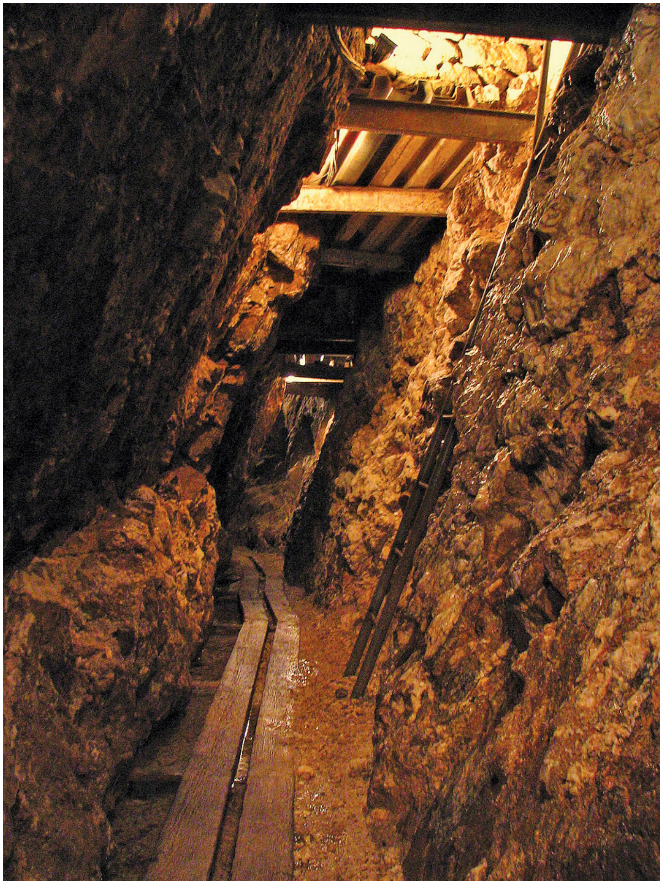
Zachowane do dziś drewniane tory w średniowiecznej kopalni srebra w Suggental w Niemczech

Konie, zaprzężone do wypełnionych węglem lub rudą wagoników, ciągnęły je do najbliższej rzeki, kanału albo do brzegu morza, gdzie przeładowywano urobek na statki. Jeden koń pociągowy był w