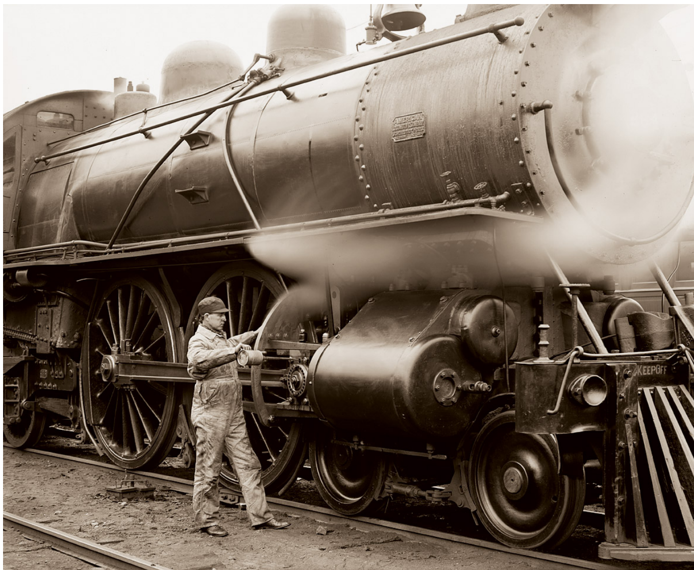
Oliwienie maszyny przed startem - USA, 1904 r.

Korzyści, wynikające z wprowadzenia kolei, stały się oczywiste dla wszystkich. Przedłużano więc nie tylko stare linie w Anglii czy Stanach Zjednoczonych, lecz budowano nowe, zwłaszcza w krajach europejskich. W 1844 roku kolej uruchomili Duńczycy (na obecnym terytorium Niemiec) i Szwajcarzy. W 1848 roku kolej dotarła do Hiszpanii, w 1849 roku - do Szwecji (wąskotorowa), w 1854 roku - do Norwegii, w 1856 roku - do Portugalii, a w 1869 roku - do Grecji. W 1842 roku oddano do użytku pierwszą linię kolejową na obecnym terytorium Polski (Wrocław-Oława). Z kolei, w zależnym od Rosji, Królestwie Polskim budowę pierwszej linii kolejowej zainicjowano już w 1835 roku, czyli 7 lat przed powstaniem linii, na należącym do lepiej rozwiniętych Prus, Śląsku. Inwestycję zrealizowano jednak dopiero 14 czerwca 1845 roku, oddając podmiejski odcinek przyszłej linii Warszawsko-Wiedeńskiej (ukończony w 1848 roku). Pod koniec XIX wieku długość linii kolejowych na świecie wynosiła już ponad 800 tys. kilometrów.