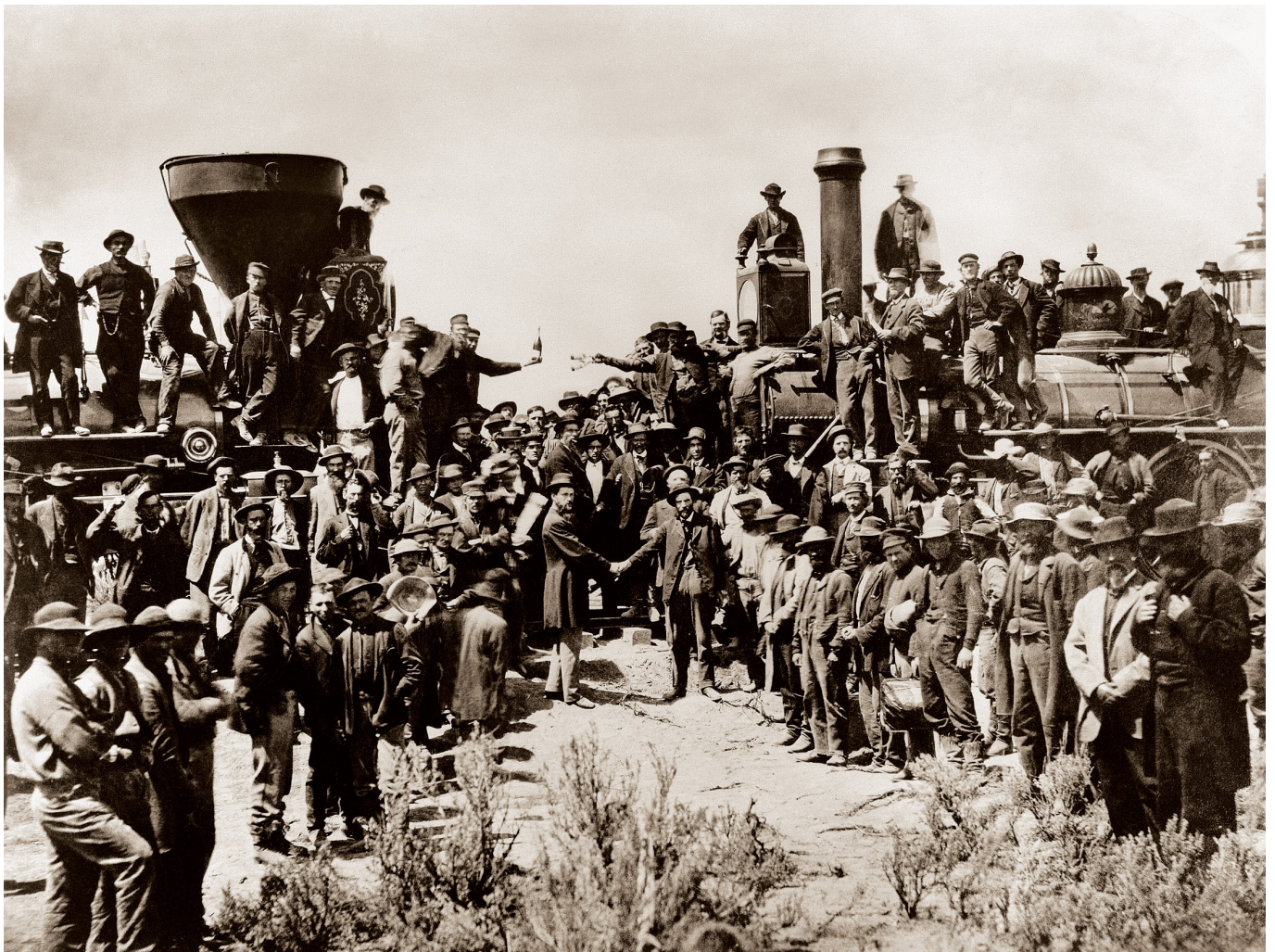
Historyczny moment połączenia odcinków linii Union Pacific i Central Pacific - USA, 1869 r.

Trakcja parowa dominowała na kolejach przez prawie 100 lat. Zmiana nastąpiła z chwilą wprowadzenia trakcji elektrycznej i spalinowej. Szczególnie groźną konkurentką parowozu okazała się lokomotywa elektryczna. Zaprezentował ją po raz pierwszy - 31 maja 1879 roku na Wystawie Rzemiosła i Przemysłu w Berlinie - niemiecki konstruktor, Ernst Werner von Siemens. Była to niewielka maszyna o mocy zaledwie 2,5 kW, zasilana przy pomocy trzeciej szyny. Lokomotywę elektryczną szybko udoskonalono i już w 1881 roku przekazano do użytku pierwszy odcinek kolei elektrycznej na trasie Berlin-Lichterfelde. W 1903 roku na odcinku Berlin-Zossen lokomotywa elektryczna pobiła rekord prędkości, przebywając w ciągu godziny 211 kilometrów. Pierwszą zaś lokomotywę spalinową zademonstrował w 1891 roku inny konstruktor niemiecki - Gottlieb Daimler. Konstrukcję tę wprowadzono w Niemczech do użytku w 1912 roku.